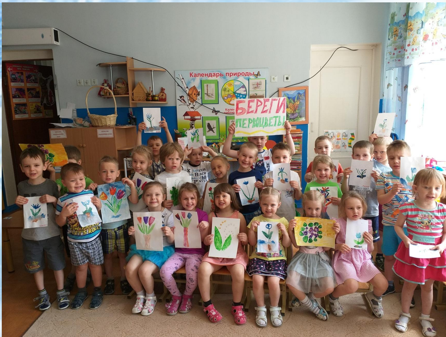
Выставка рисунков «Береги, первоцветы»