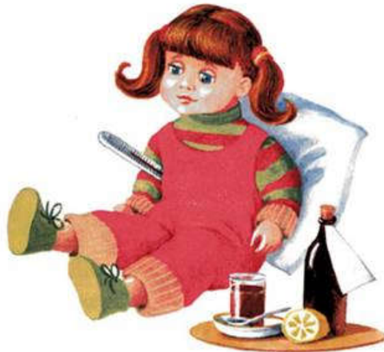
Валентин Берестов Больная кукла

Тихо. Тихо. Тишина. Кукла бедная больна. Кукла бедная больна, Просит музыки она. Спойте, что ей нравится, И она поправится.